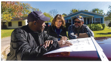
地区基金とシエラ | My ROTARY

ロータリークラブとロータリーグループは、世界中の地域社会で、平和の促進、疾病の予防と治療、水と衛生の改善、母子の健康改善、教育の促進、地元経済の促進といった活動にあたっています。このようにクラブの取り組みを支えているのが、ロータリー財団の年次基金へのご寄付です。