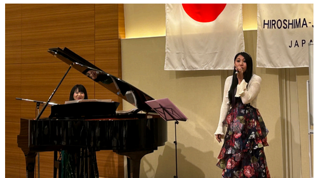
アトラクション デュエットユニット「イブシロン」